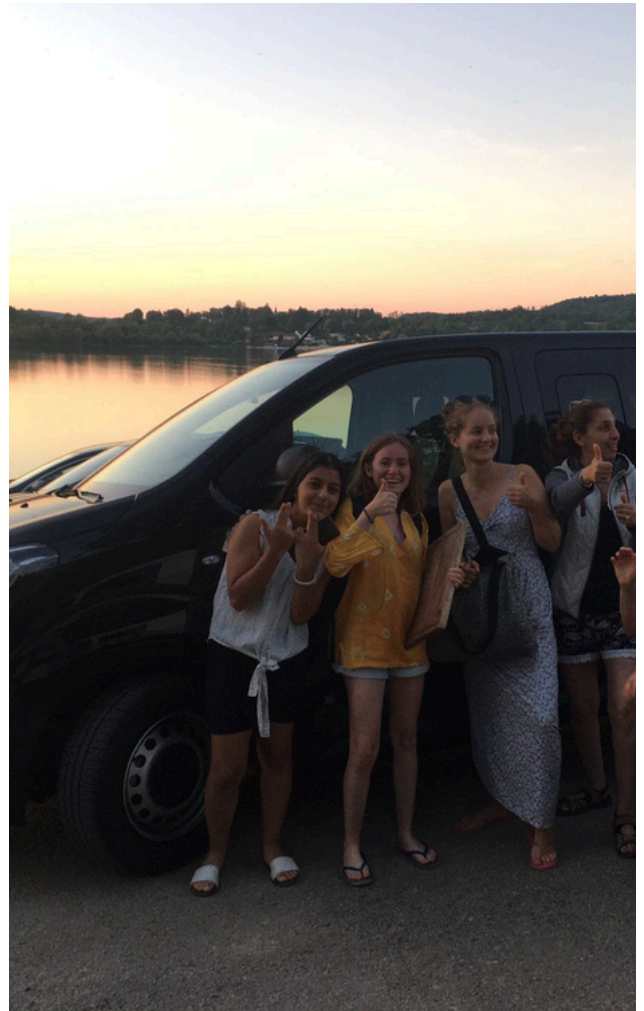
Prêt solidaire à ATD Quart Monde

Pour venir en aide aux ukrainiens touchés par le conflit dans leur pays, Ayvens a mis en place plusieurs actions de soutien, en commençant par un don de 70 000 € à la Fondation de France. Ce don a permis une aide d'urgence aux populations réfugiées à travers le soutien à trois associations locales (« Hope and homes for children » en Roumanie, « Premières Urgences » en Pologne, et « Triangle Génération Humanitaire » en Ukraine). Un don de véhicule à Médecins sans frontières et un prêt de véhicule à l'OEEI (Office des Echanges Européens et Internationaux de Clichy) et à l'association rennaise All Behind Ukraine ont permis de répondre aux besoins de transport pour acheminer les biens de première nécessité en Ukraine. Enfin, des jours de bénévolat ont été offerts aux collaborateurs afin qu'ils puissent s'engager dans des opérations de soutien aux ukrainiens.